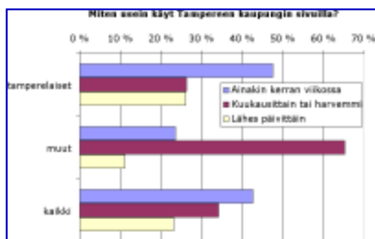
Tampereen sivujen käyttöuseus

Tamperelaisvastaajista lähes kolme neljästä kävi kaupungin Internet-sivuilla ainakin kerran viikossa. Muut vastaajat vierailivat sivuilla paikallisia huomattavasti harvemmin. Tavallisin tahti oli enintään kerran kuussa.