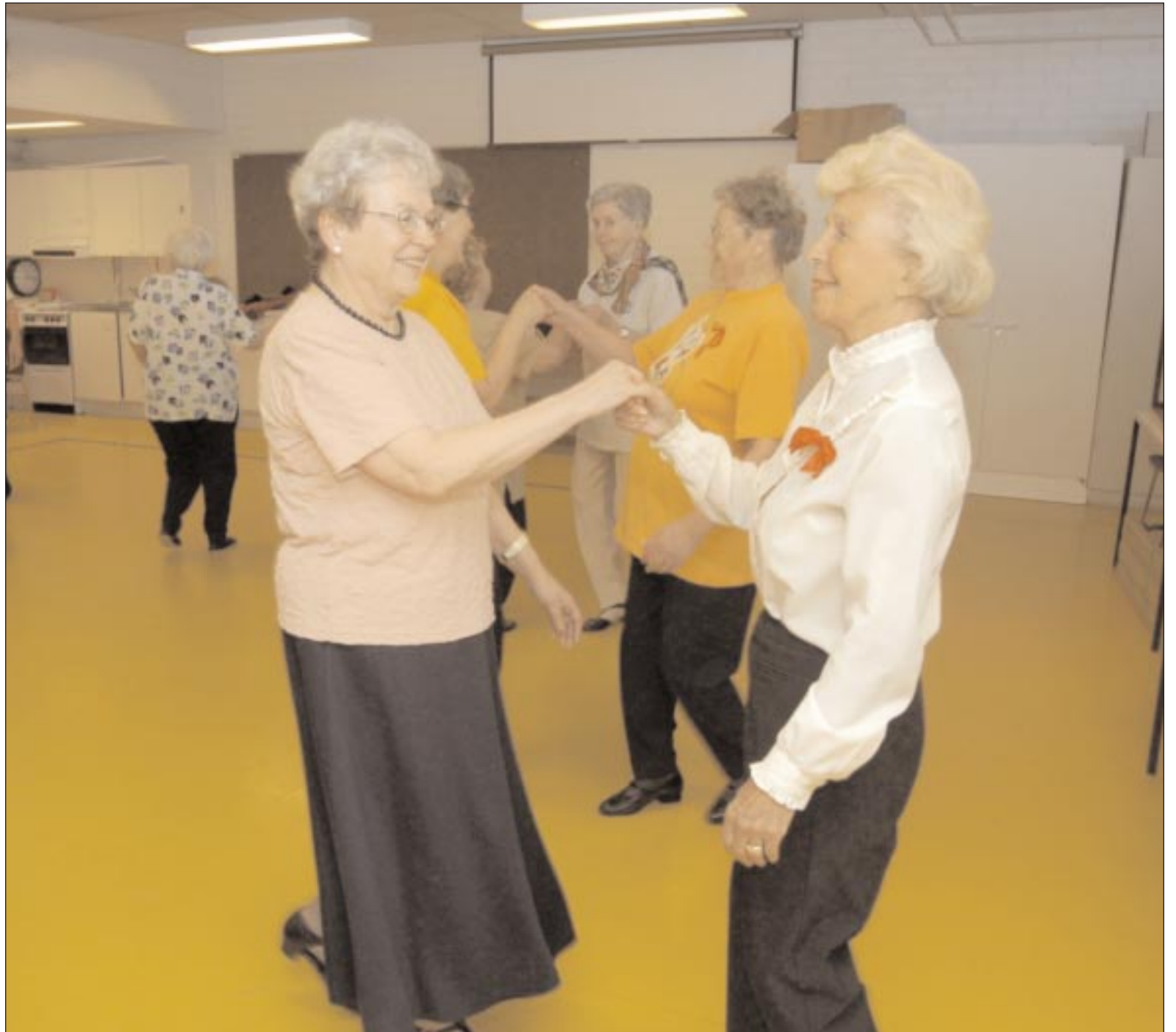
Ikäihmisten Tanssin Vuoden pääjuhlassa nähdään useita tanssiesityksiä. Senioritanssin yhteisesityksessä ovat mukana myös Tampereen Kuntoliikunnan senioritanssijat.

Jaana Kalliomäki, teksti