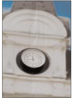
Kaupunkilaisten pyynnöstä raatihuone kertoo taas oikean kellonajan.

– Ihmiset ovat tottuneet katsomaan raatihuoneen kelloa, ja meille tuli soittoja joissa kaivattiin kelloa takaisin. Niinpä sitten laitoimme kellon tulle paikalle.