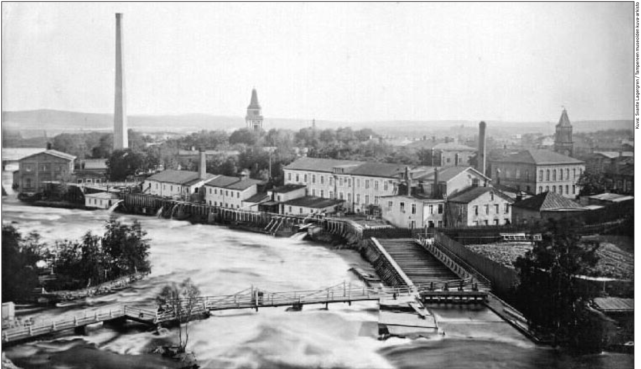
Tampere näytti tältä vuonna 1880. Etualalla Frenckellin tehtaat ja koski.