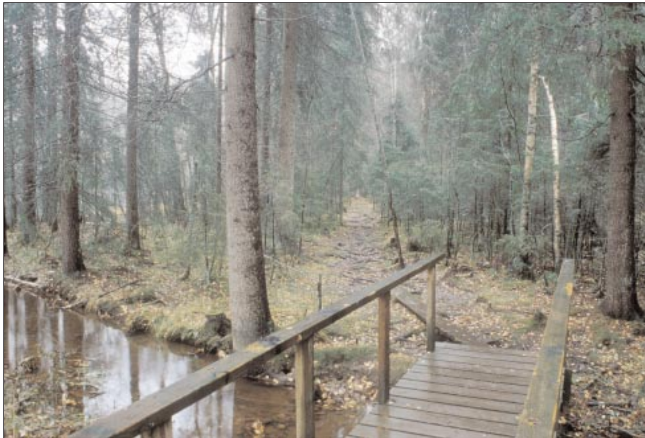
Halimasjärven luonnonsuojelualueen luonto on monipuolinen soineen, rantoineen, kallioineen ja lehtoineen.

Tietoa Tampereen luonnosta löytyy osoitteesta www.tampere.fi/ymparisto . Alkuun pääsee myös Tutustu Tampe-