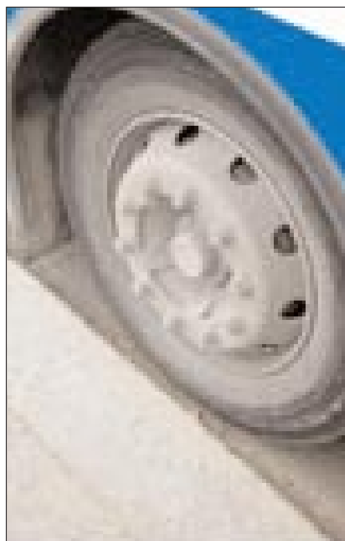
Raskas liikenne on yksi suurimpia melun aiheuttajia.