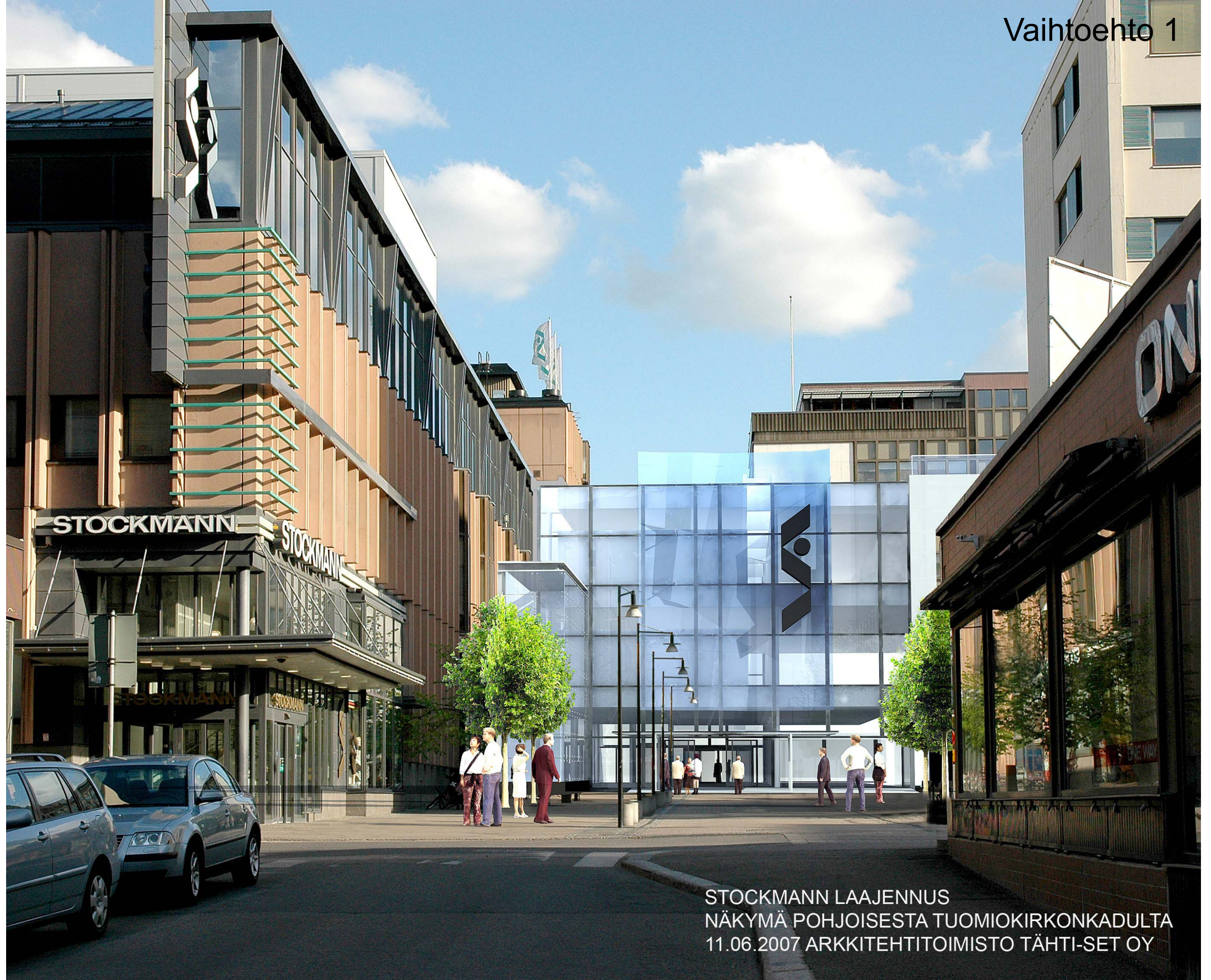
STOCKMANN LAAJENNUS NÄKYMÄ POHJOISESTA TUOMIOKIRKONKADULTA 11.06.2007 ARKKITEHTITOIMISTO TÄHTI-SET OY