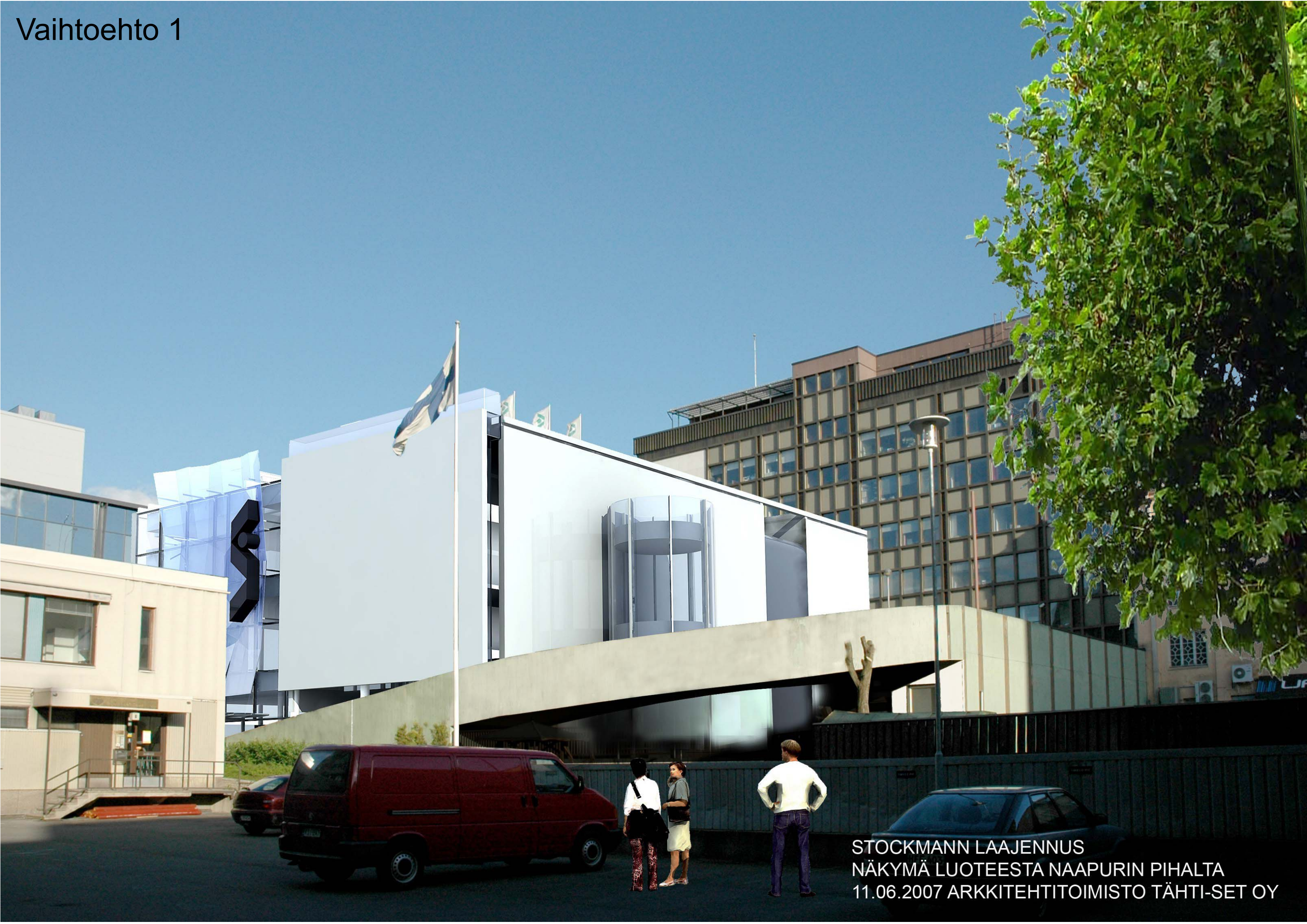
STOCKMANN LAAJENNUS NÄKYMÄ LUOTEESTA NAAPURIN PIHALTA 11.06.2007 ARKKITEHTITOIMISTO TÄHTI-SET OY