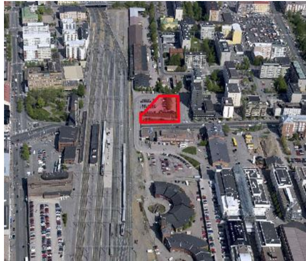
Ilmakuva kaava-alueesta v.2003