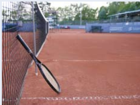
Rosendahlin kentät Pyynikillä palvelivat Tampereen ATP-turnauksessa 26 vuoden ajan. Jatkossa kilpaillaan tenniskeskuksen kentillä Ruutulassa.

– Silloin kaiken pitää olla kunnossa. Meillä on vahva organisaatio, tuomarit, pallopojat ja muu henkilökunta. En usko, että ongelmia tulee, Granroth ennakoii.