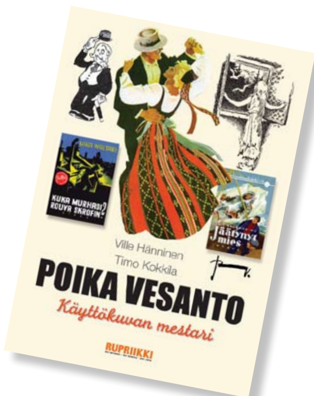
Näyttelyyn liittyy oheisjulkaisu Poika Vesanto, käyttökuvan mestari . Rupriikin julkaisuja 2. 2009.

Näyttely on suunniteltu kiertäväksi ja sen voi vuokrata kesäkuusta 2009 lähtien.