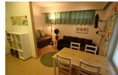
Tapaamistilat Kuusikon perhetukikeskuksessa