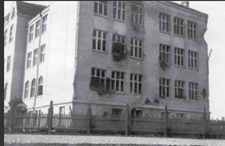
2 Tammelan koulu