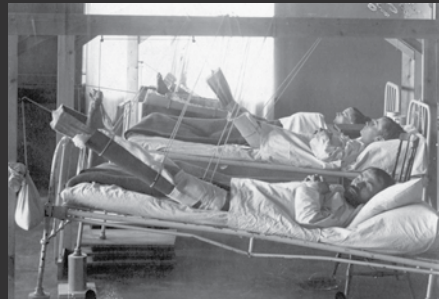
3 Johanneksen koulu