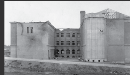
10 Entinen teknillinen opisto