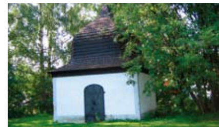
9. Kirkkomaa, Gaddin hautakappeli