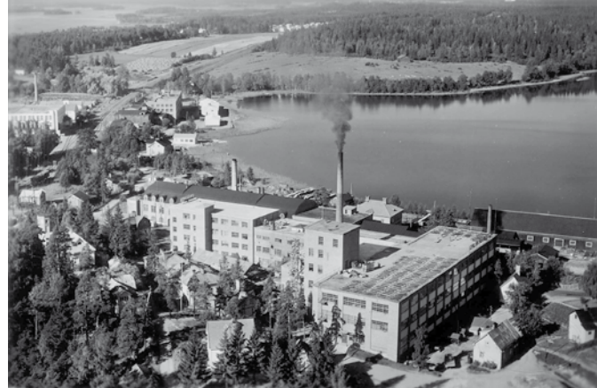
Teollisuuskeskittymä Tohlopin rannalla