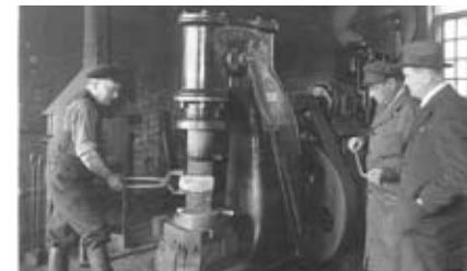
4. Teollisuuskeskittymä Tohopin rannalla, työkuva tehtailta