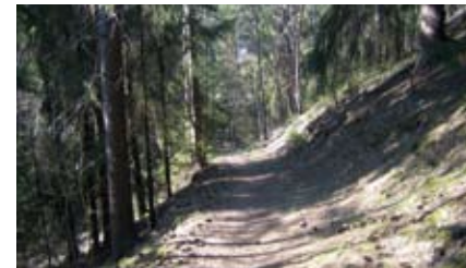
3. Epilänharju, ruumiinpuntari-polkku