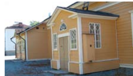
8. Harjun koulu